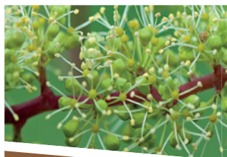
GRENACHE ANTI COULURE